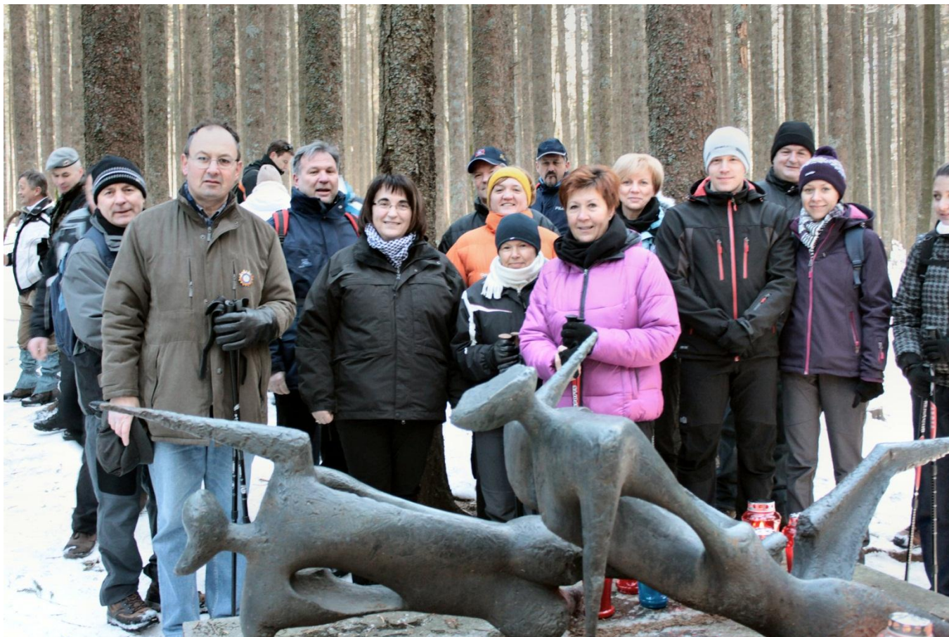
Delegacija Združenja 91 na proslavi na Osankarici

Naslov: Združenje vojnih invalidov 91, Luznarjeva 3a, 4000 Kranj Telefon gsm: 040 13 18 91 Internetna stran: www.zdruzenje91.si Elektronski naslov: info@zdruzenje91.si