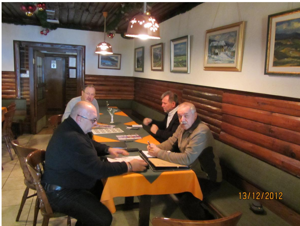
Člani Upravnega odbora na seji v Kranju