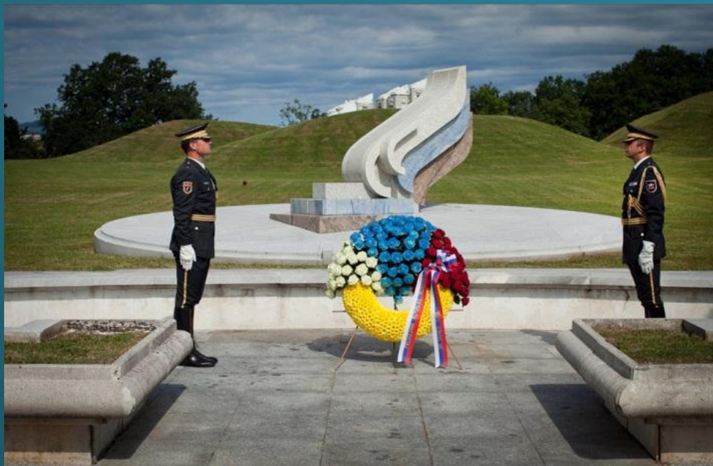
SPOMENIK VSEM PADLIH IN UMRLIH V AGRESIJI 1991