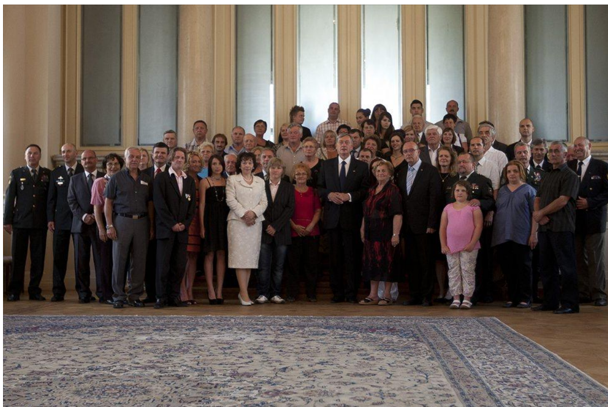
Srečanje ranjenih in svojcev umrlih pri Dr. Danilu Türku, junij 2012