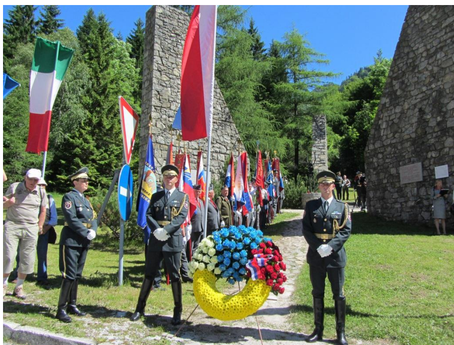
Spomenik žrtvam taborišča Mauthausen na Ljubelju

Vse dodatne informacije glede dogodkov in aktivnosti lahko dobite na telefonski številki 040 13 18 91 ali na e-naslov info@zdruzenje91.si , koledar aktivnosti pa bo sproti ažuriran na naši spletni strani www.zdruzenje91.si .