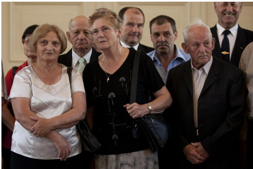
Svojci padlih na sprejemu pri Predsedniku Republike

Združenje 91 namerava tekom letošnjega leta izvesti raziskavo o prisotnosti post travmatskega sindroma med žrtvami agresije leta 91. Po naših podatkih nekateri vojni invalidi že imajo psihične posledice zaradi dogodkov leta 91, to pa pomeni, da na podlagi zdravstveno ugotovljenega PTSD lahko uveljavljajo dodatno invalidnost. V državah bivše SFRJ so take raziskave že opravili in tudi priznali upravičencem določen status. V Sloveniji se v 22 letih nihče ni polotil tovrstne raziskave, menimo pa, da je to potrebno. V Biltenu 91 boste našli obrazec vprašalnika, katerega lahko izpolnete in nam ga pošljete na: Združenje 91, Luznarjeva 3a, 4000 Kranj, ali skeniranega preko elektronske pošte. Po končani analizi rezultatov bomo objavili stanje na tem področju in tudi svetovali posameznikom, kako lahko ukrepajo naprej.