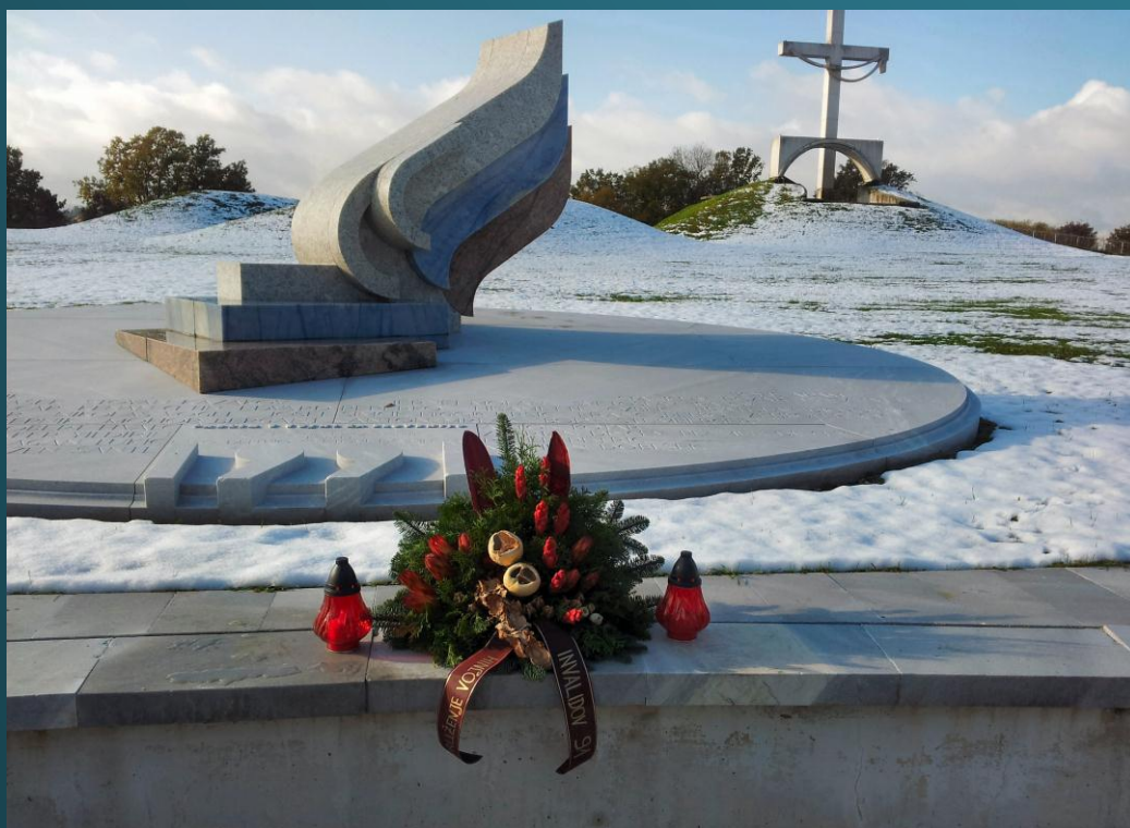
POKLON ŽRTVAM – DELEGACIJA ZDRUŽENJA 91