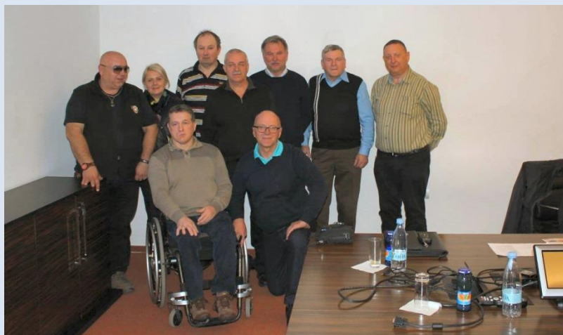
Novo vodstvo Združenja 91

Zbora članov se je udeležilo skupaj 28 članov iz vseh krajev države, kar je zadostno število, če upoštevamo oddaljenost in razpršenost članstva in seveda stroške prevoza. Zbor je potekal v konstruktivnem ozračju in vsebinsko uspešno, saj smo si zadali nove naloge, ki jih bomo poskušali uresničiti v naslednjem letu.