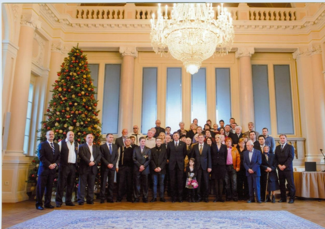
Sprejem svojcev umrlih in ranjenih pri Predsedniku Republike Borutu Pahorju in Predsedniku Vlade RS, v Ljubljani, 23.12. 2014