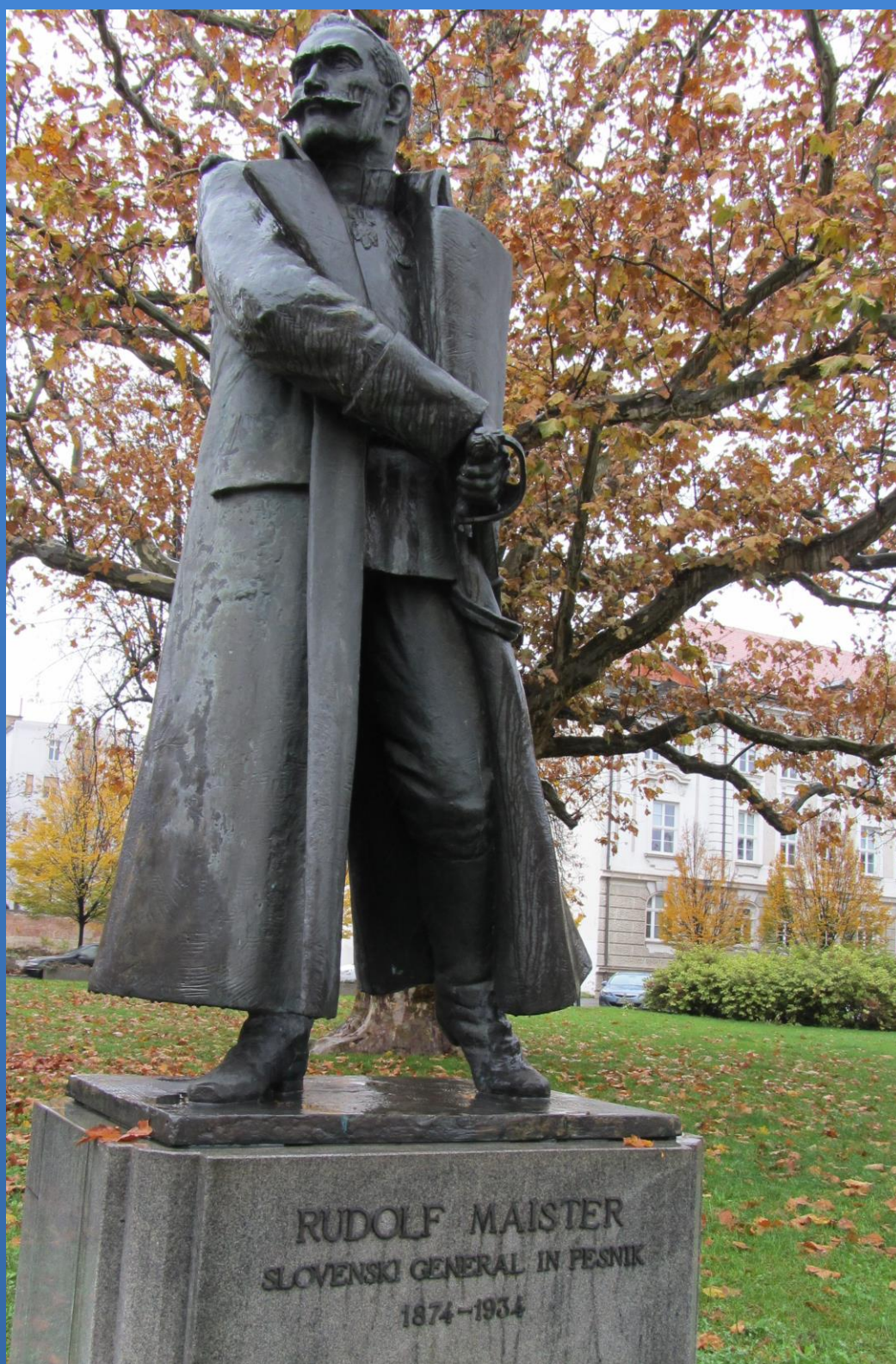
SPOMENIK SLOVENSKEMU GENERALU IN PESNIKU RUDOLFU MAISTRU – 1874 - 1934