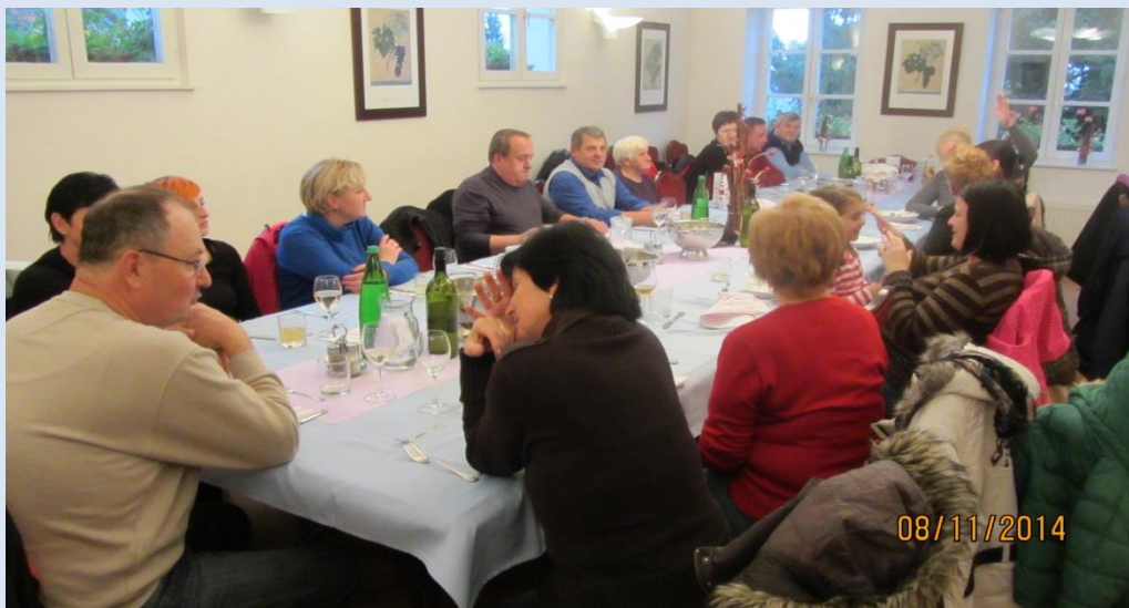
Srečanje v Mariboru – Dvorec Meranovo

Člani združenja se bodo individualno udeležili raznih svečanosti in proslav v svojem lokalnem okolju. Na večjih prireditvah državnega nivoja, pa se bodo svečanosti udeležili predstavniki združenja. Zaželeno je, da se udeležimo pomembnih svečanosti v čim večjem številu. Prav tako je zaželeno, da o udeležbi posameznikov na lokalnih ali državnih srečanjih, obvestite naše združene na naš e-naslov: info@zdruzenje91.si .