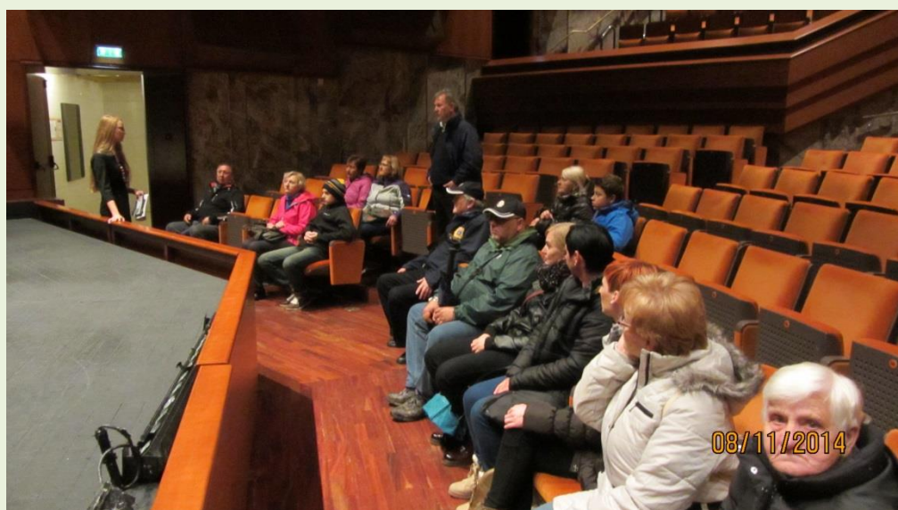
Obiskali smo tudi Mestno gledališče Maribor