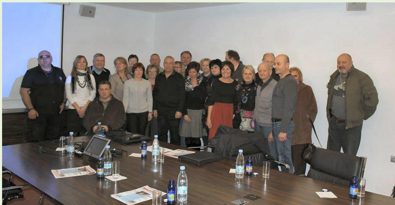
Udeleženci Zbora članov v Laškem 2015