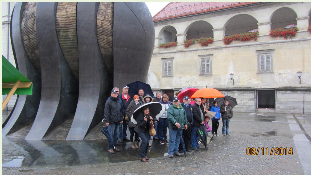
Ogledali smo si znamenitosti Mestne občine Maribor