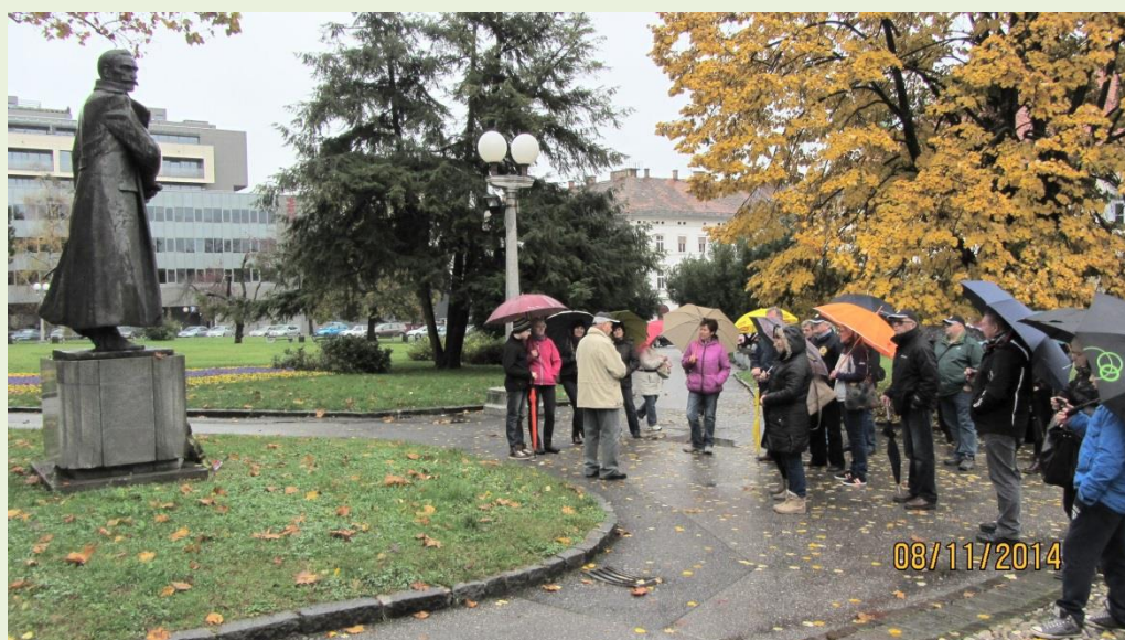
Peš smo si ogledali Znamenitosti mesta Maribor