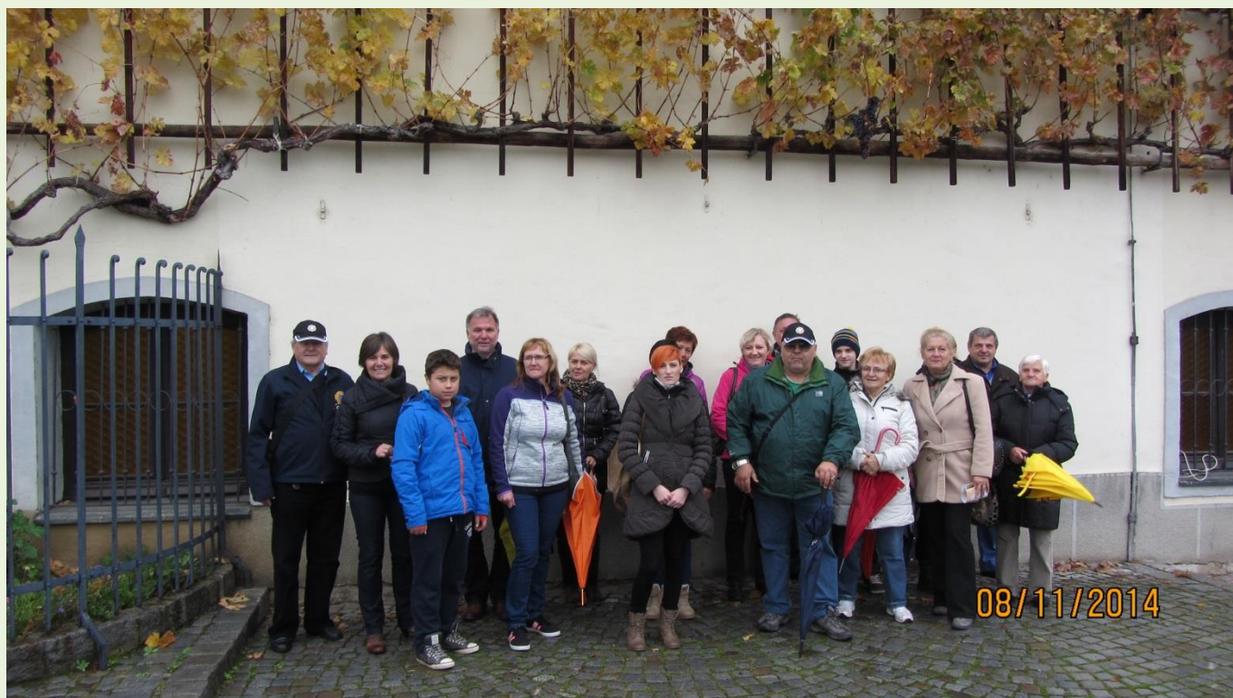
Pod najstarejšo vinsko trto v Mariboru in na svetu