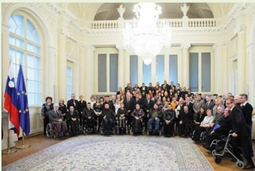
Sprejem od svetovnem dnevu invalidov v Ljubljani, december 2014