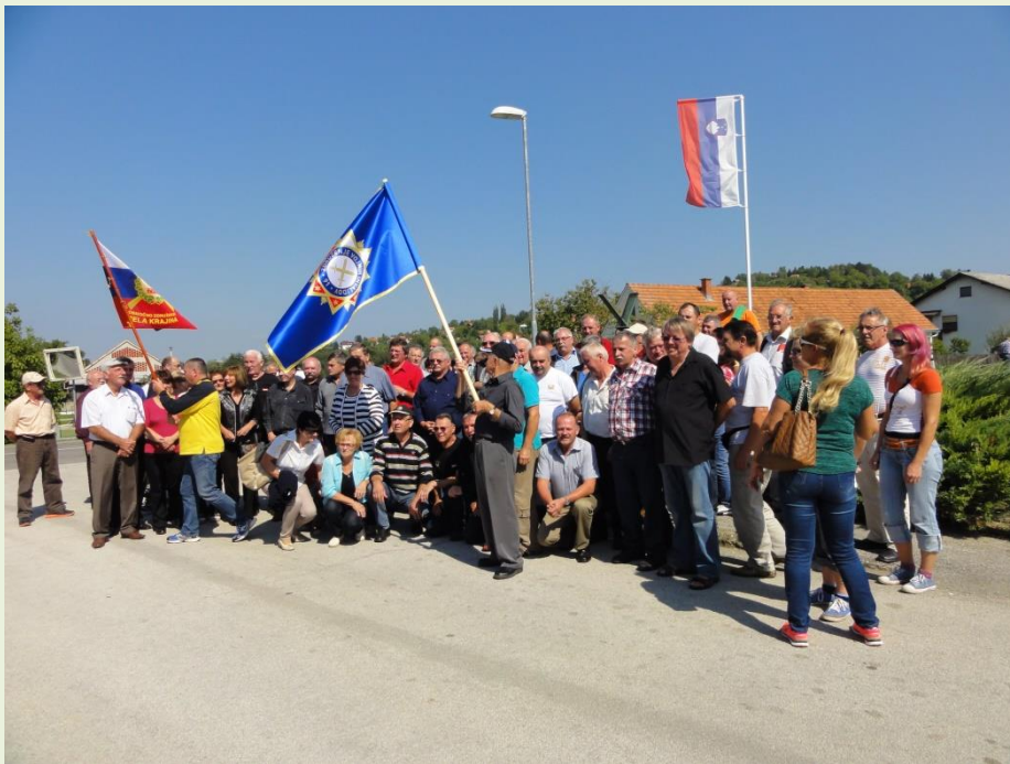
Pri obeležju v Rigoncih smo se srečali z veterani ZVVS iz Metlike