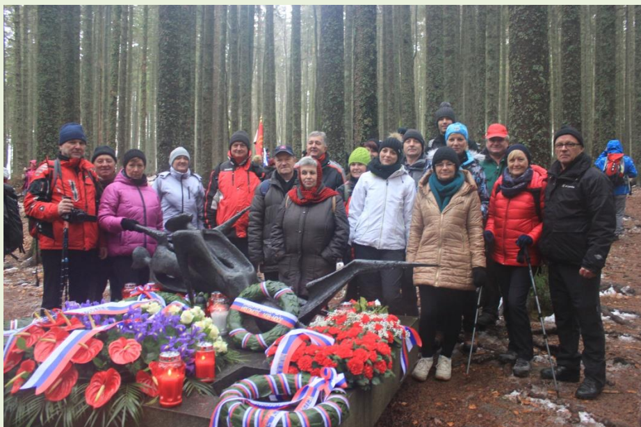
Proslava na Osankarici na Pohorju