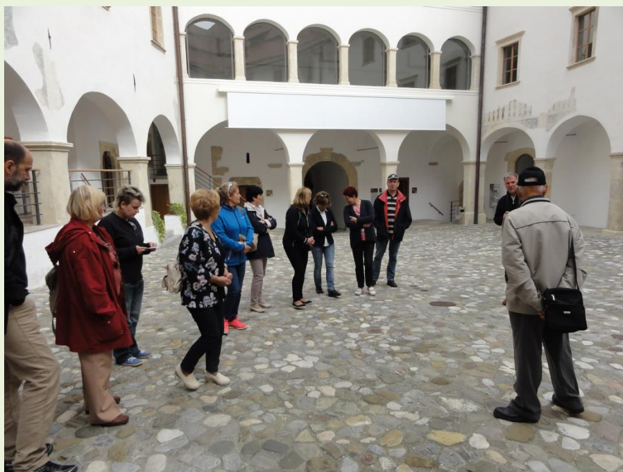
Ogledali smo si grad Rajhenburg v Brestanici

Sestavni del programa dela je tudi koledar aktivnosti v letu 2016.