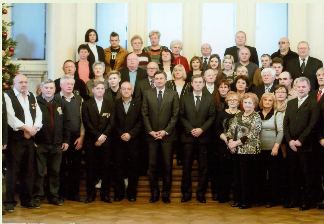
Na sprejemu ob dnevu samostojnosti in enotnosti Ljubljana, 23. 12. 2015