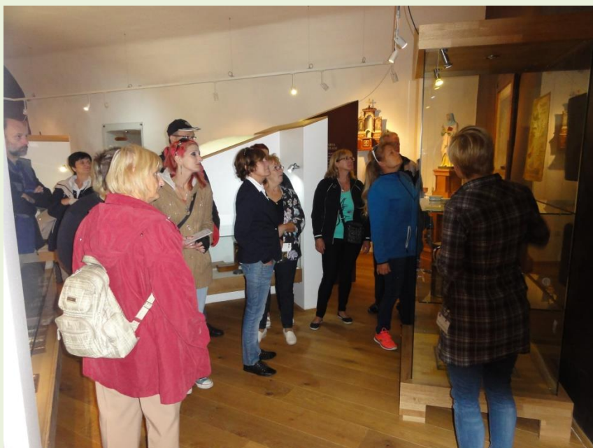
Zanimiva zgodovina Brestanice in okolice, razstavljena v gradu