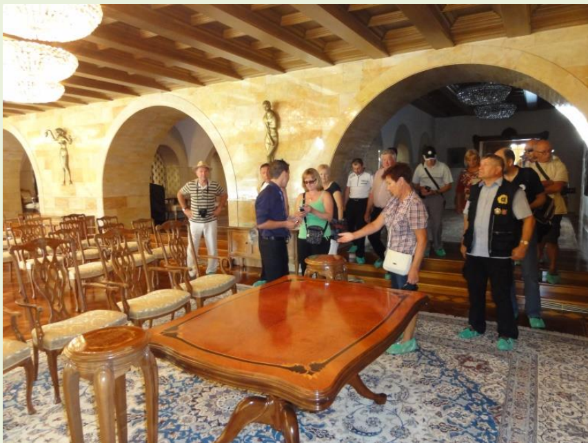
Najlepši prostor v gradu, kjer sprejemajo visoke državnike in občasno tudi nas