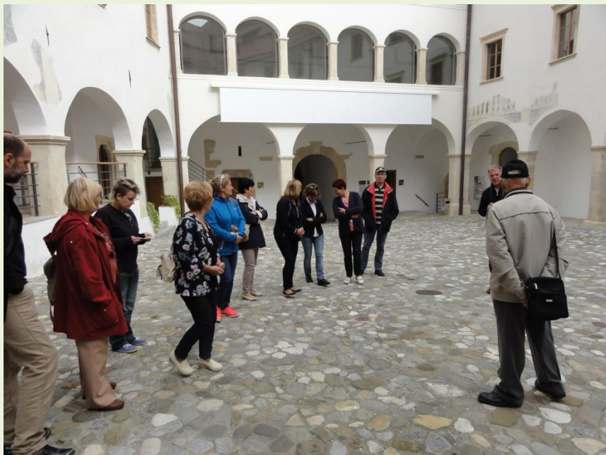
Pred gradom Rajhenburg pri Brestanici na Dolenjskem