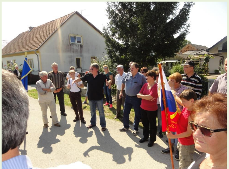
Dogodke junija 1991 v Rigoncih nam je pojasnil poveljujoči takratne enote TO