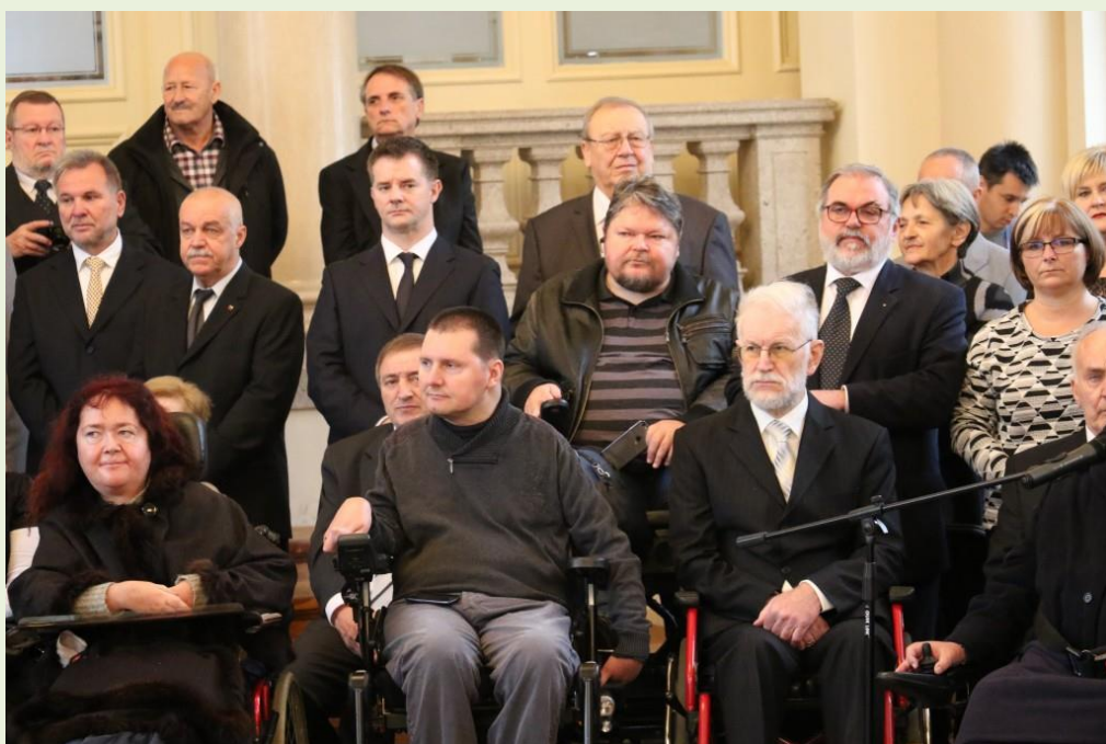
Na sprejemu pri predsedniku Vlade RS dr. Miru Cerarju