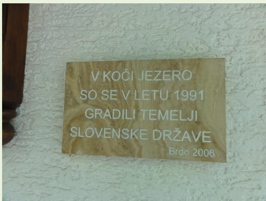
Bili smo tudi v koči, kjer so se leta 1991 odvijali prvi tajni pogovori o osamosvojitvi Slovenije