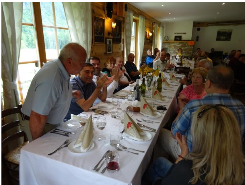
Omizje z gosti