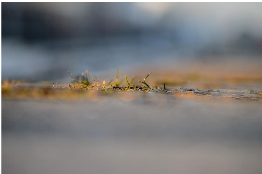
Trave 3, Timotej Furek, Maribor