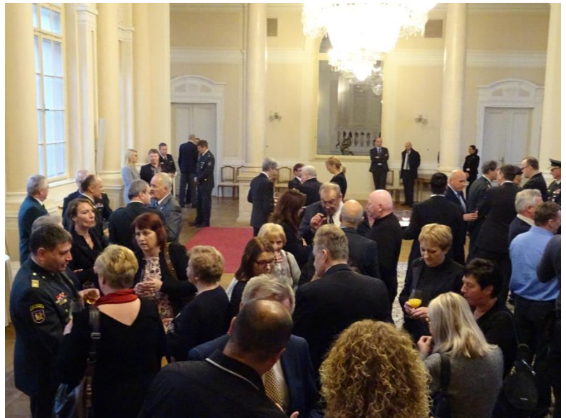
Sprejemi v Predsedniški palači so priložnost za izmenjave izkušenj in različnih praks. Po sprejemu se člani Združenja 91 udeležimo še tradicionalne prednovoletne večerje.