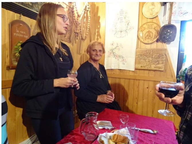
Terezijo od zadnjega rojstnega dne muči stalna žeja. Enega je spila tudi ob naši napitnici. Še na mnoga leta!