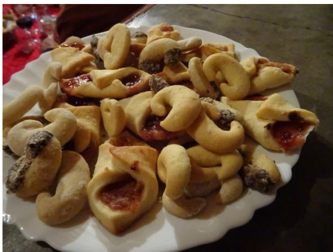
Martinin krožnik

Zaradi "bolezni v ansamblu", smo bil primorani poseči po sodobnem pomagalu – spletu (kulinarika.net)