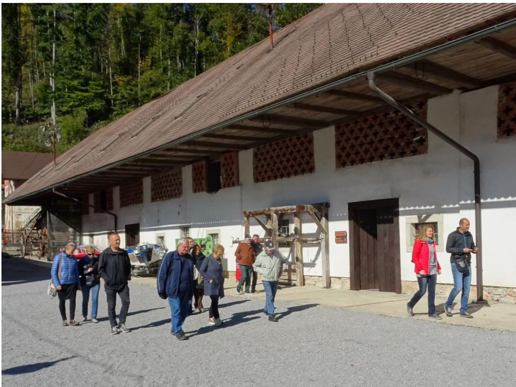
Na začetku smo zelo pohlevno sledili našemu vodniku skozi muzej.

Resnično gre za edinstven muzej, saj si v njem lahko ogledaš od »starodobnih vozil«, do muzeja smučí, muzej obdelave lesa, mlinarstva... Izčrpne predstavitve našega vodiča so nam dale vedeti, da bi potrebovali cel dan, če bi si hoteli ogledati v miru vse zanimivosti. Žal pa smo bili časovno vezani k odhodu do naslednje točke izleta.