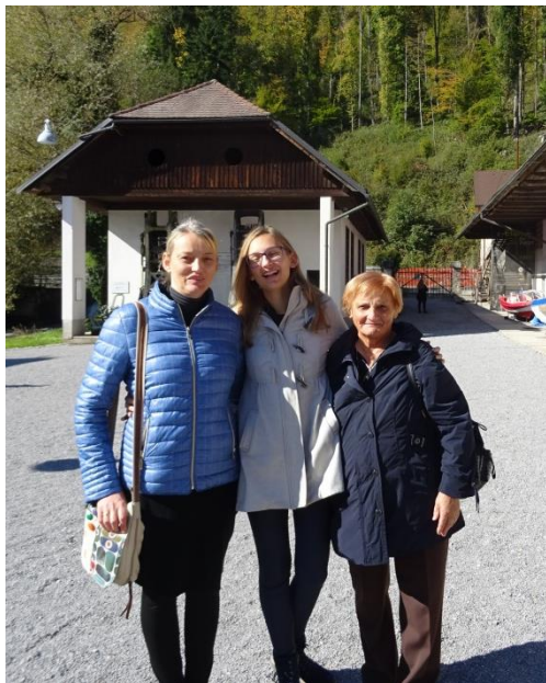
Moljkove - tri!