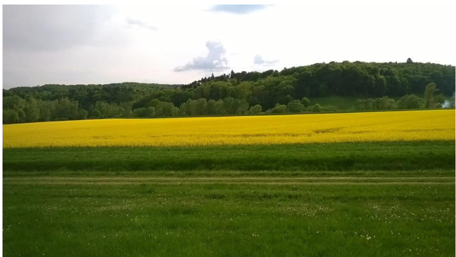
Ob reki Pesnici, Manica Koprčina