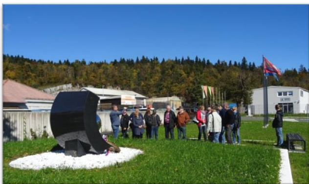
Pri spominskem obeležju v Zapolju pri Logatcu