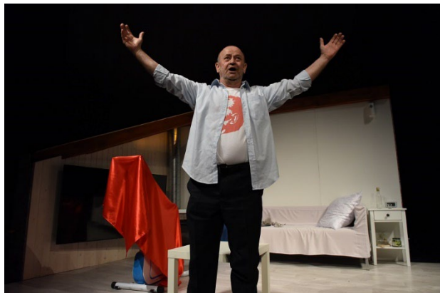
Gajaš pod masko