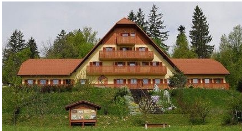
Čebelarški dom na Brdu pri Lukovici

Spoštovani članice in člani Zdrúženja 91, pozdravljeni!