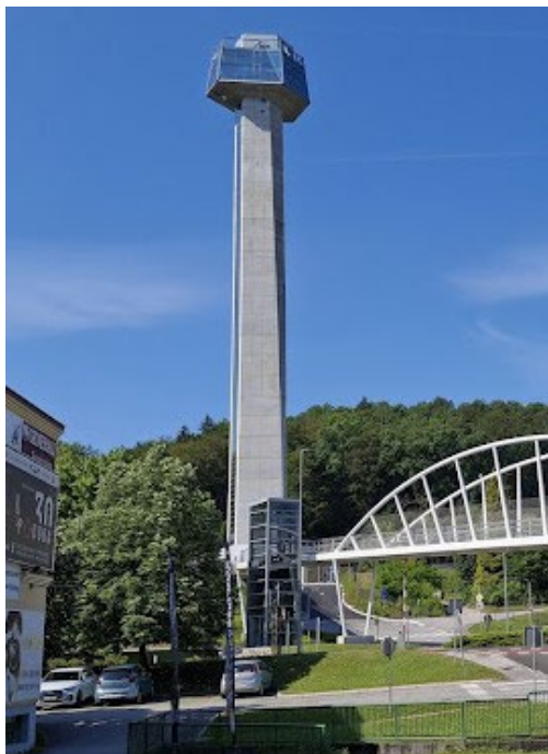
Slika 1: Razgledni stolp Kristal

Spoštovane članice, spoštovani člani Združenja 91, pozdravljeni!